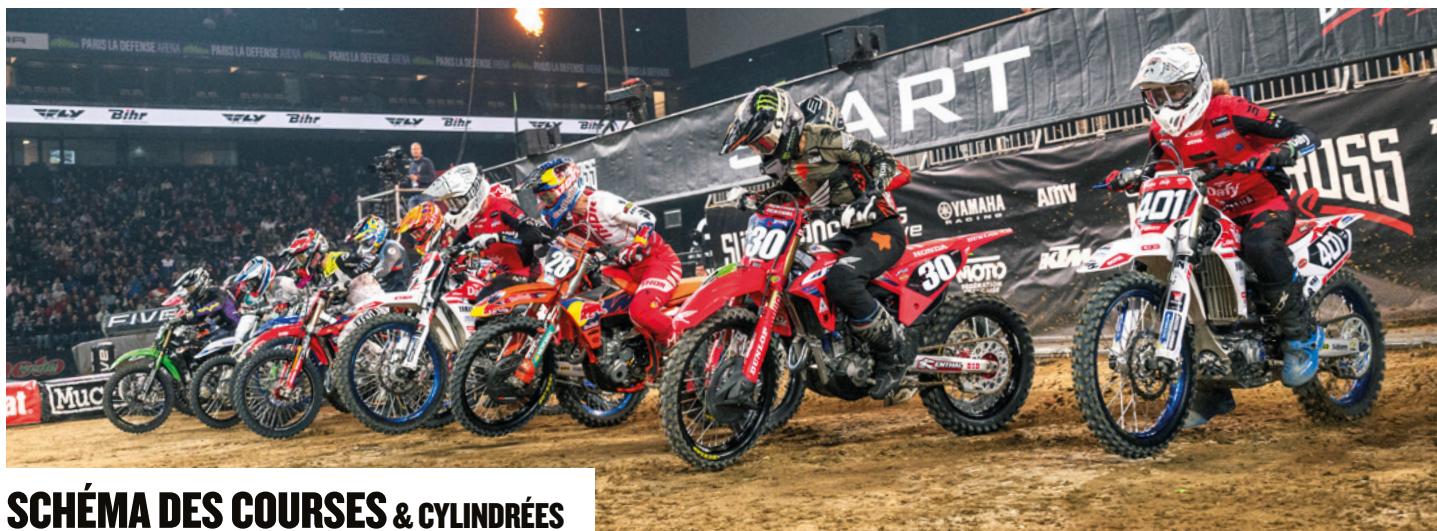
SCHÉMA DES COURSES & CYLINDRÉES