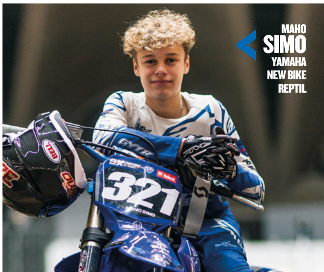
MAHO SIMO YAMAHA NEW BIKE REPTIL